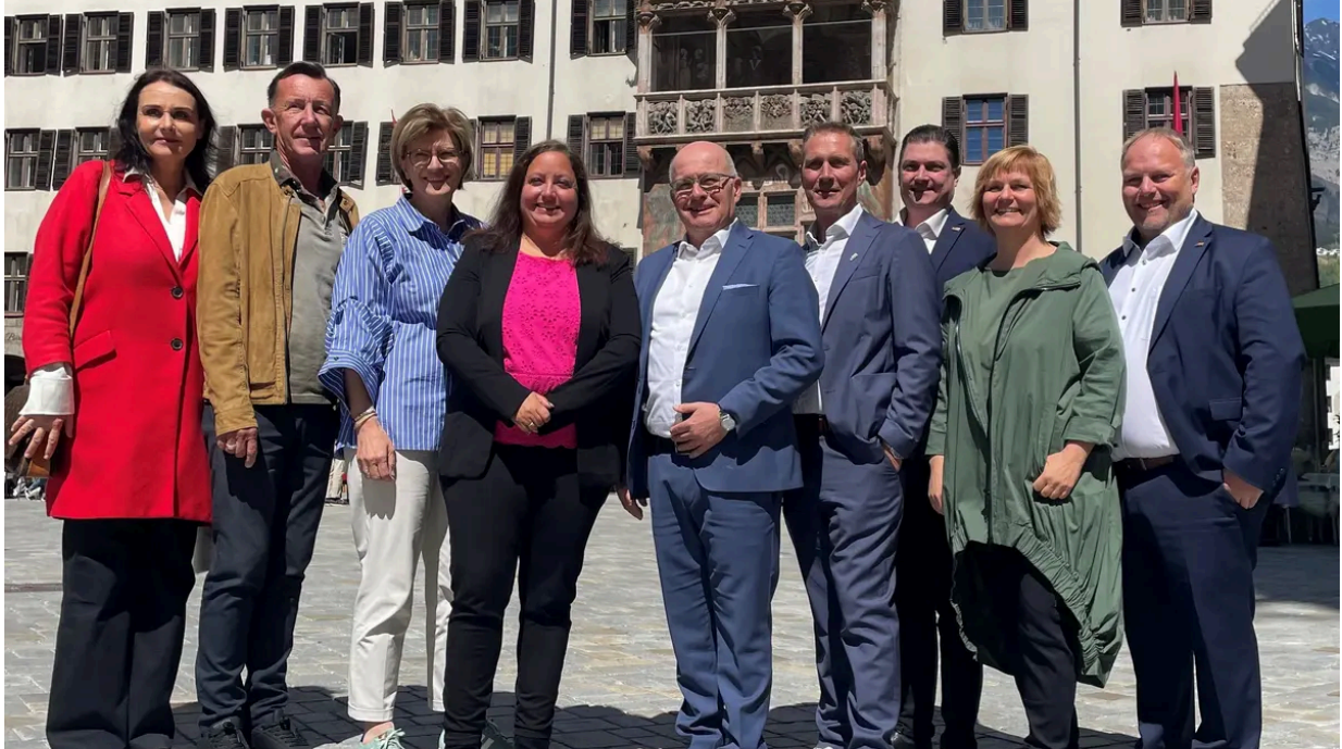
Oppositionspartei "Das neue Innsbruck" mit der Bilanz zu zwei Jahren Caprese-Regierungsarbeit in Innsbruck.

Die Fraktion „Das Neue Innsbruck“ zieht nach zwei Jahren eine kritische Bilanz der Caprese-Koalition (Liste JA-Jetzt Innsbruck, Grüne und SPÖ). Vor allem mangelnde Transparenz und fehlende Abstimmung werden bemängelt. Auch die Zusammenarbeit mit der Stadtregierung wird hinterfragt.